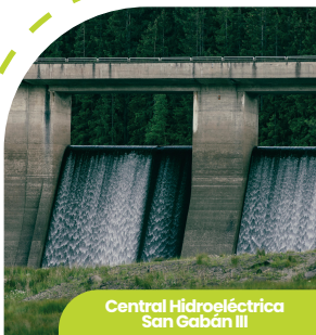
Central Hidroeléctrica San Gabán III