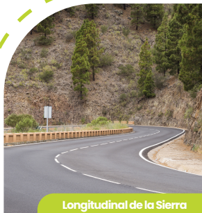
Longitudinal de la Sierra