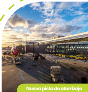
Nueva pista de aterrizaje