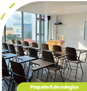
Paquete 6 de colegios