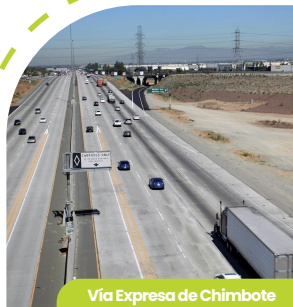
Vía Expresa de Chimbote