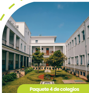
Paquete 4 de colegios