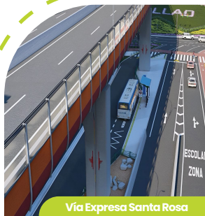
Vía Expresa Santa Rosa