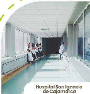
Hospital San Ignacio de Cajamarca