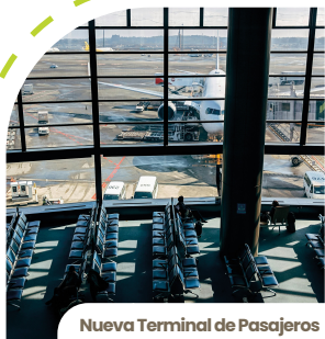
Nueva Terminal de Pasajeros