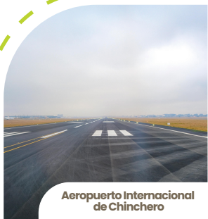
Aeropuerto Internacional de Chinchero