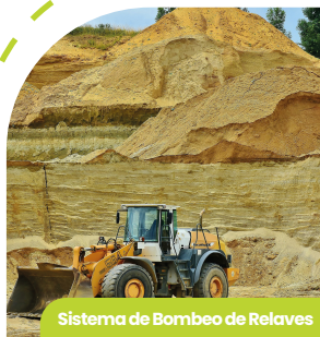
Sistema de Bombeo de Relaves