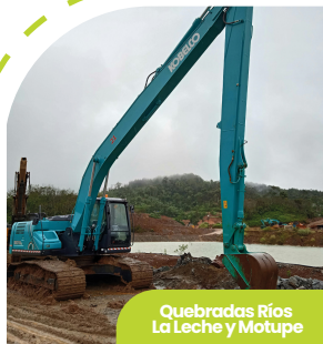
Quebradas Ríos La Leche y Motupe